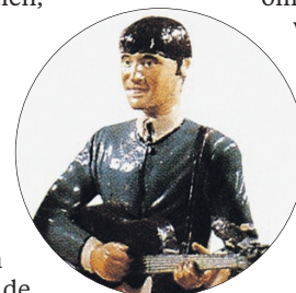
→ Beatlesmerchandise uit de jaren zestig.

nazisme en de kruistochten daar gelaten.' Hij ergert zich aan platenmagazines die de commerciële uitbuiting van de opgroeiende jeugd stimuleren met advertenties voor kleding en cosmetica. 'Maar waarom moet daar nu zo zuur over worden gedaan? Iedere jeugd heeft zijn eigen excessen en het getokkel op gitaren en het gezwijmel is volmaakt onschuldig. Dat kan waar zijn, maar het is ook volmaakt geestdodend.'