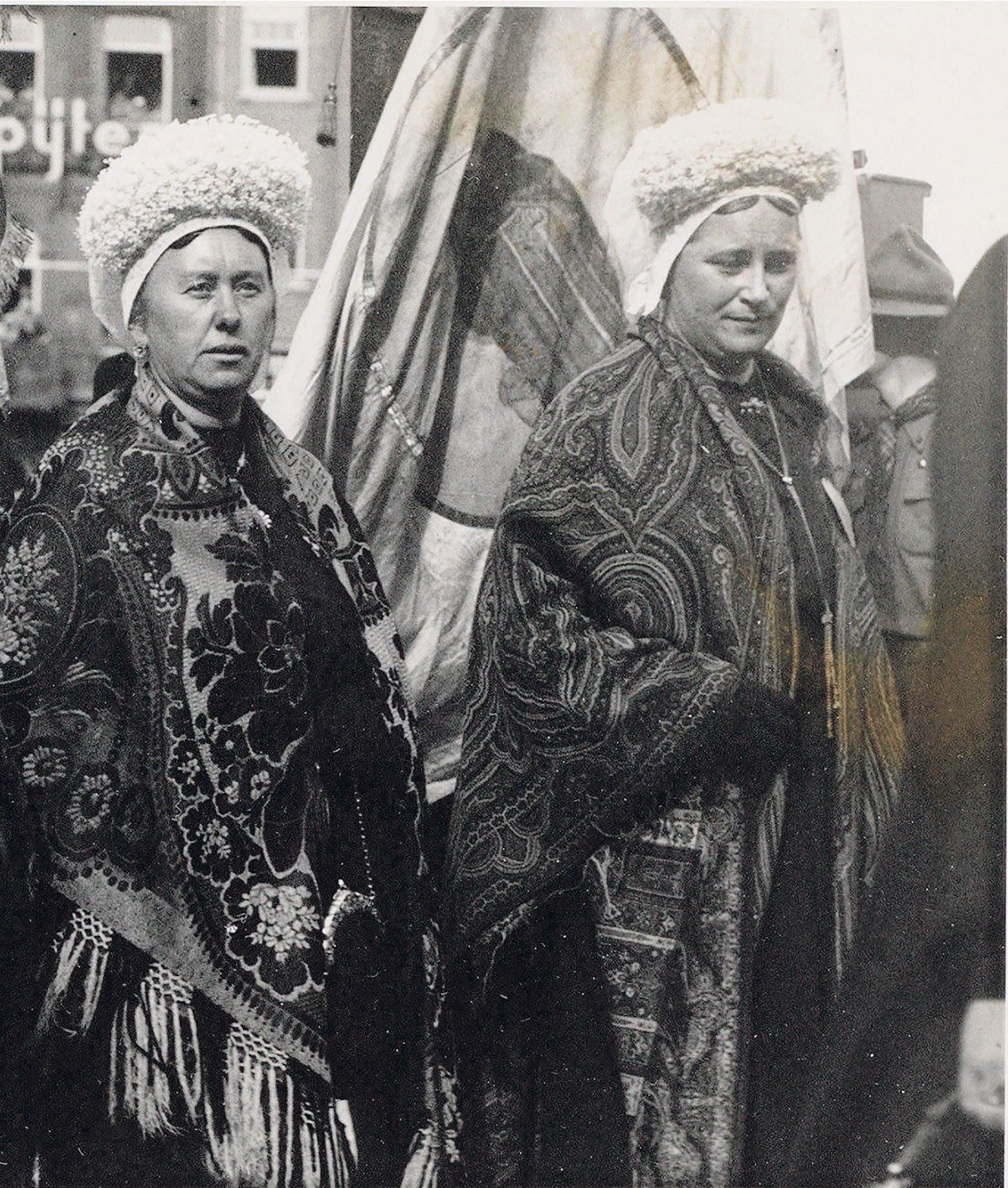
→ 1938: Friese klederdracht op het Stadionplein voor het 40-jarig regeringsjubileum van koningin Wilhelmina.

"Friezen waar ook in de wereld zoeken elkaars gezelschap op in zogeheten kriten. De meeste Amsterdamse kriten zijn inmiddels ter ziele, maar er is nog steeds een Friese kaatsvereniging in Amsterdam."