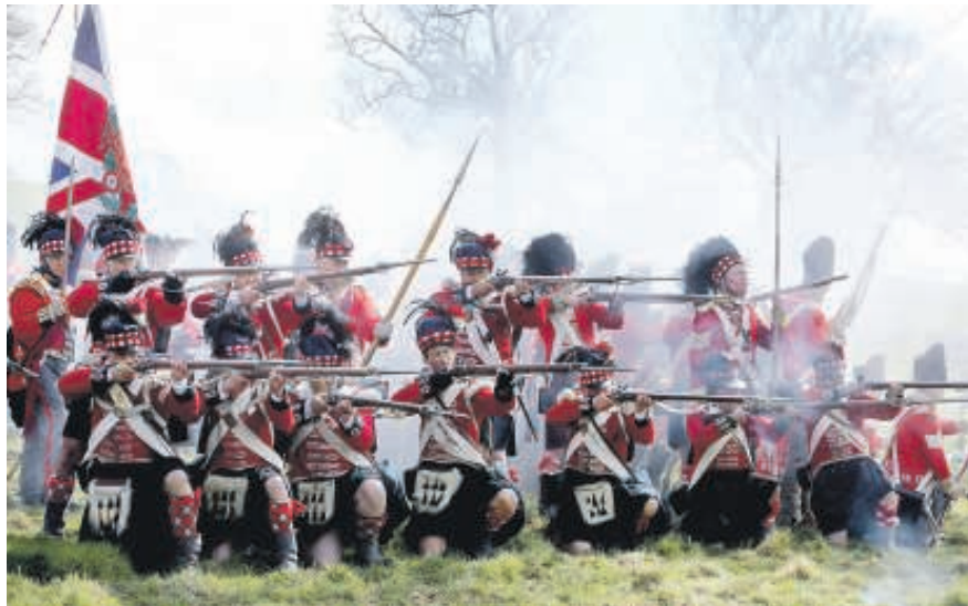
Britse acteurs oefenen bij het Engelse Bury voor de reconstructie van de Slag bij Waterloo.

Rond de route die hij aflegde hangt dezelfde waas van romantiek en milde dweeplucht die kleeft aan voorwerpen die Napoleon bezat, aan lokken van zijn haar en andere parafermalia. Het veldje bij Marbaix-la-Tour waar de keizer zijn troepen inspec-