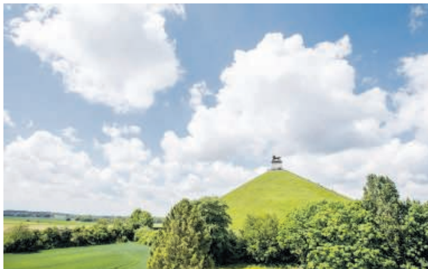
La Butte du Lion, waarop de reusachtige leeuw naar het overwonnen Frankrijk kijkt.