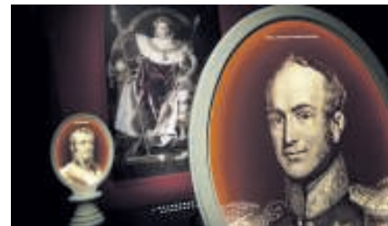
Koning Willem I.

In plaats daarvan loop ik door de wegberm terug naar het monument van de gewonde adelaar, dat de laatste veldslag van de Grande Armée memoreert. Daarvandaan overzie ik het terrein. Donkere wolven pakken zich samen boven de heuvel in de verte waarop de reusachtige leeuw naar het overwonnen Frankrijk kijkt. De groteske bult