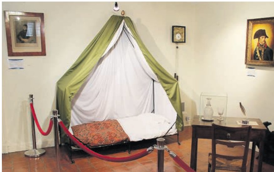
In de Chambre de l'Empereur staat het opvouwbare veldbed van de keizer.

negeer het laatste bordje van de Route Napoléon dat me wil verleiden linksaf te slaan, naar het eigenlijke slagveld. Ik hoef de sombere zuilen en de andere monumenten van de winnende partijen niet te zien, net zomin als de onbeholpen gedenksteen voor het Franse regiment dat nog een volslagen overbodig overwinninkje wist te behalen. Ik ga niet naar het bezoekerscentrum, niet naar het panorama met het enorme schildertje van de slag, niet naar de souvenirwinkel-tjes. En ik heb al helemaal geen behoefte door te rijden naar Waterloo zelf, waar een bioscoop en een overdekte winkelgalerij