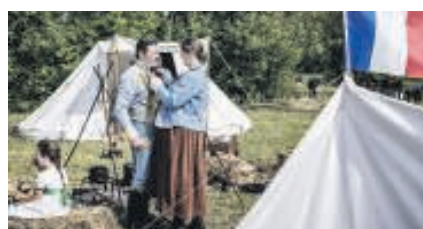
Ook Franse acteurs oefenen voor de grote reconstructie.

om in de pas te lopen, bij het vuren weigert een musket. Waarschijnlijk zal het er in het echte leger van de keizer niet veel beter aan toe zijn gegaan. En dan waren er ook nog de modder, de ontberingen, de gewonden, de doden, de chaos en ellende die deze mannen in hun romantische reconstructie maar achterwege laten. Toch geven ze me een idee hoe het toen geweest moet zijn als ze schouder aan schouder naar voren treden, hun bajonetten gericht op het fotograferende publiek. Met een luidkeels "Vive l'Empereur" eindigen ze hun charge. Ik voel