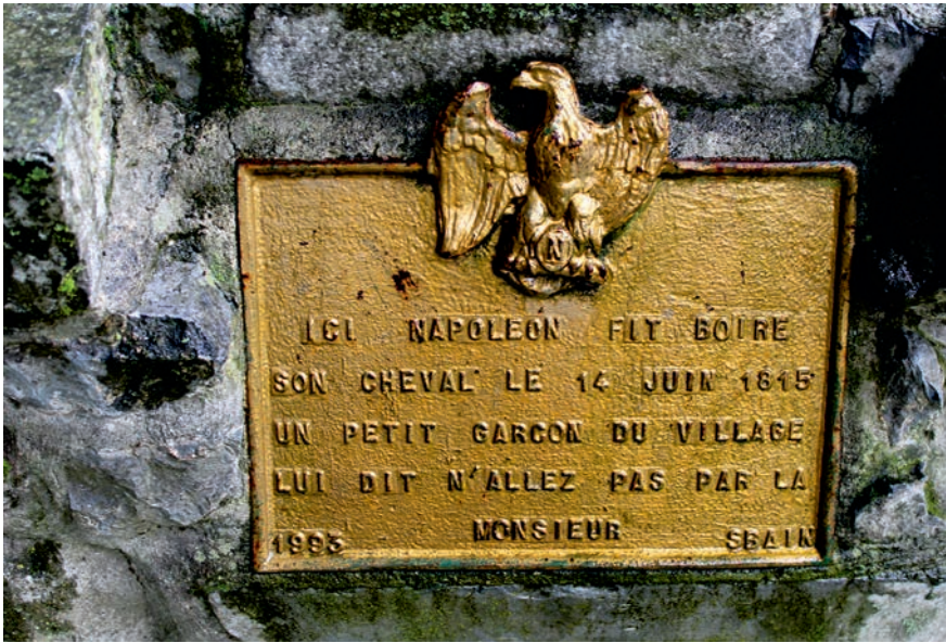
Vlak voor Waterloo zei een jongetje nog tegen Napoleon: 'Niet verder trekken'.