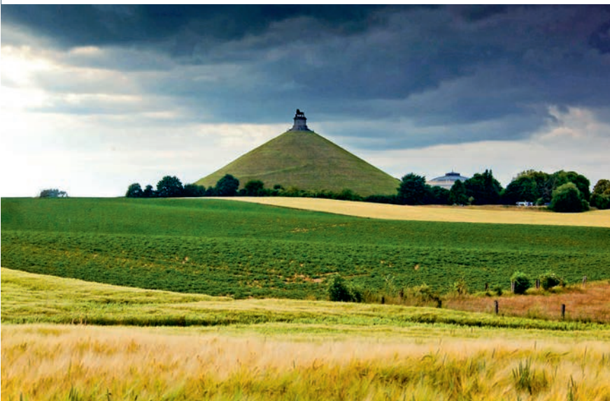
Op de vlakte van Waterloo richtte koning Willem I het monument Butte du Lion op ter nagedachtenis aan de overwinning op Napoleon.