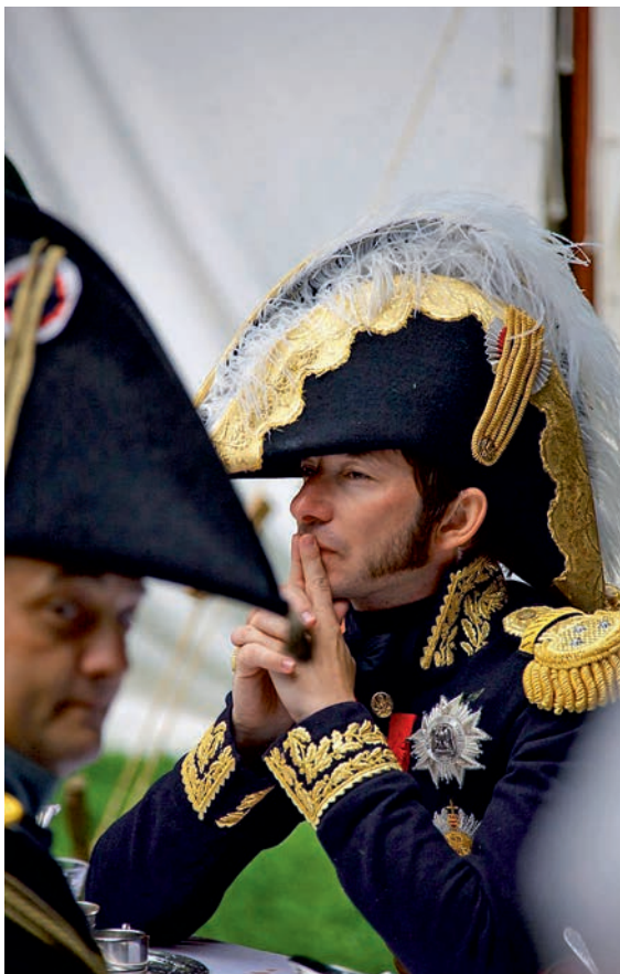
Een lid van de keizerlijke troepen, anno nu.