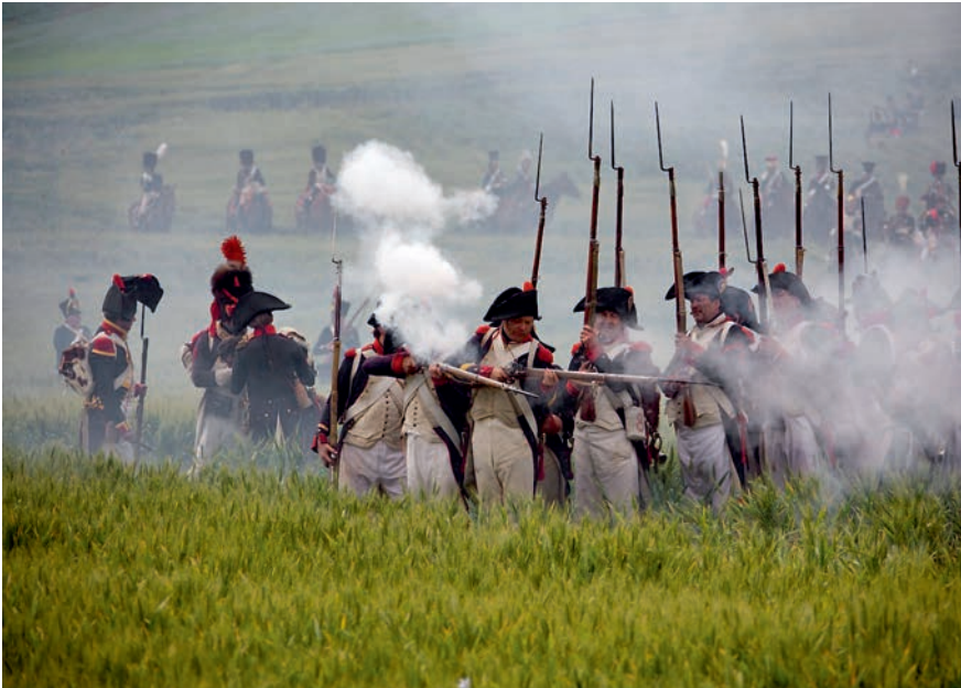
De kruitdampen trekken op. Hoeveel gevallen zijn er?