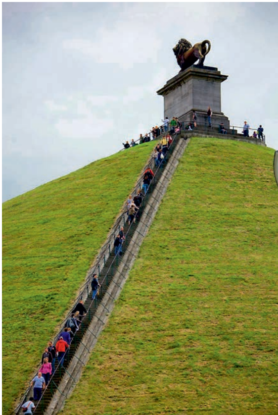
De Leeuw van Waterloo, het monument voor de slag, wordt druk bezocht.